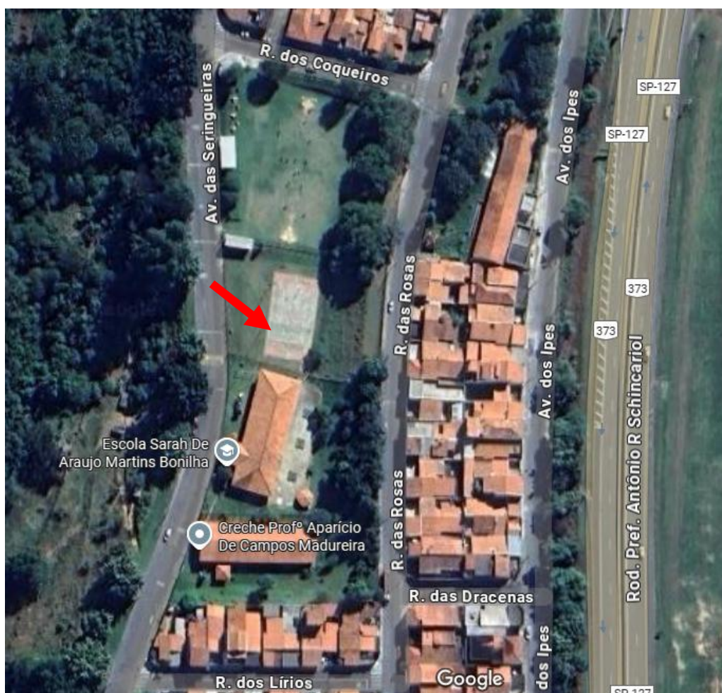
Imagem aérea do local onde deverão ser implantadas a arquibancada e cobertura metálica. A quadra existente está indicada pela seta vermelha.